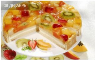
БИСКВИТНЫЙ ТОРТ С ФРУКТАМИ (41 ФОТО)